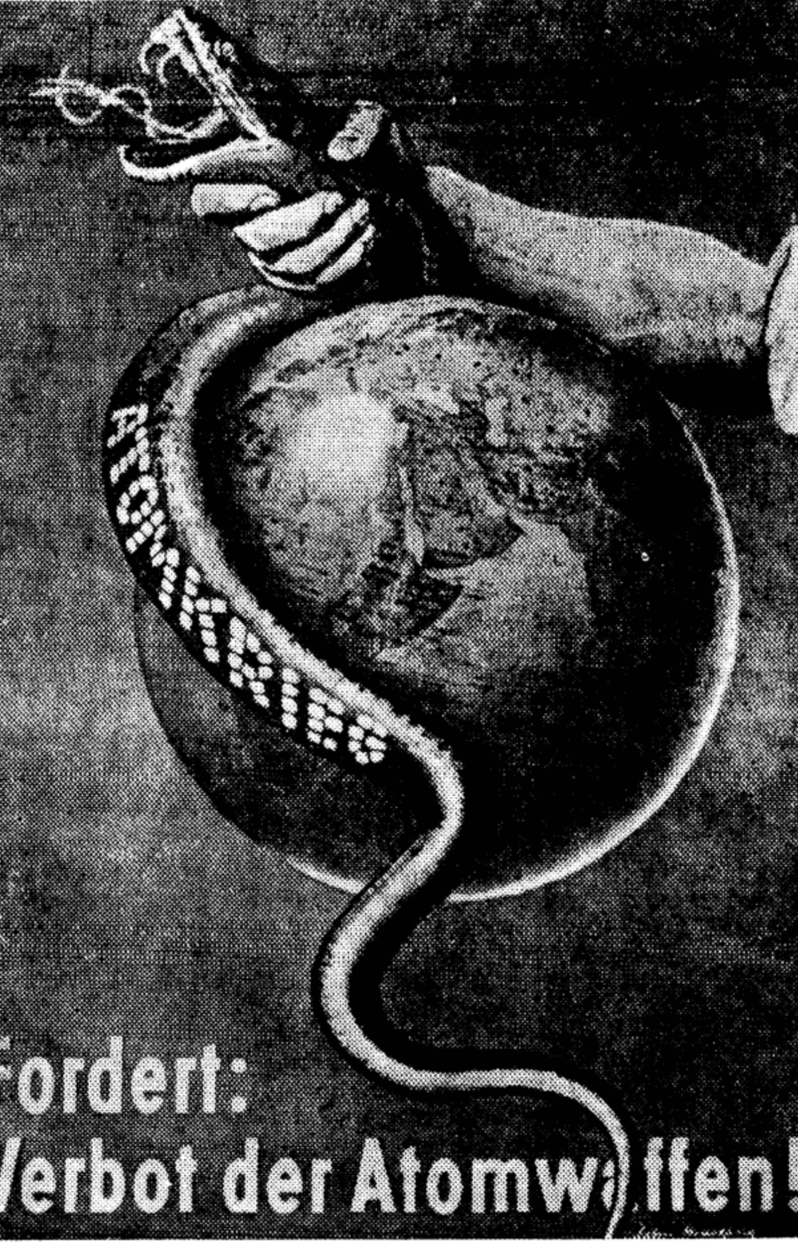
Плакат работы известного немецкого художника Джона Хартфильда